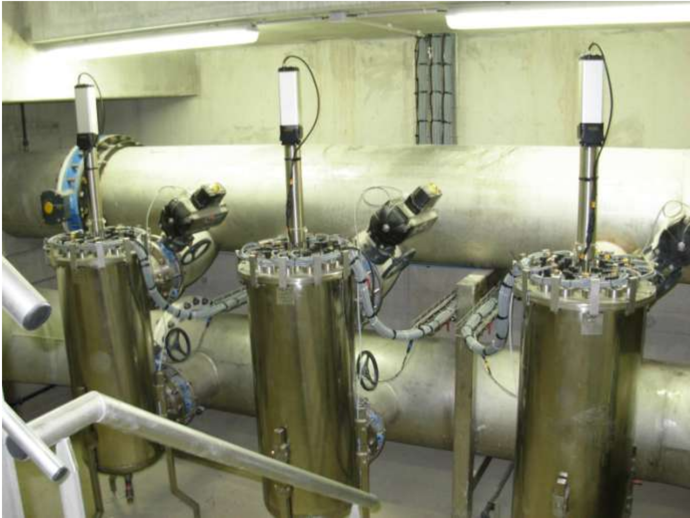
Stérilisateurs UV 1500 m 3 /h avec auto-nettoyage